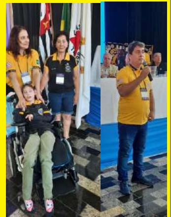
PROJETO SOBRE RODAS