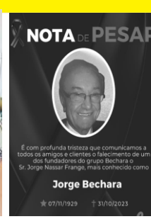
MJF JORGE BECHARA FRANGE LC DETANABI 31/10/2023