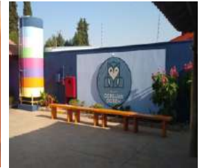
12/09- Catanduva – entrega dos equipamentos doados por LCIF para a ONG Corujas do Bem.