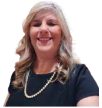
CaL Luceli Pupin Assessoria Distrital da Mútua LC Rib. Preto - Jd. Paulista

Quem é amado e lembrado, jamais desaparece completamente