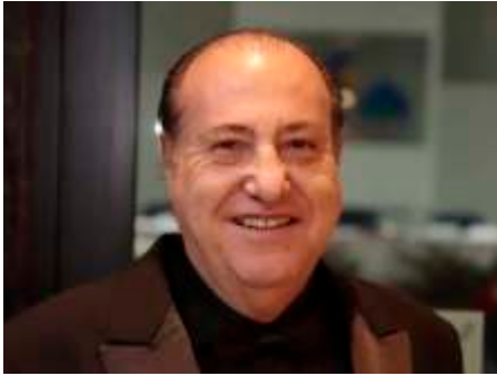
MJF AMIR CALIL DIB – LC DE RIB. PRETO CENTRO – 24/02/25+