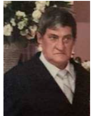
LC DE BARRETOS – CL SIDECIL SILVÉRIO JOI 12/02/25