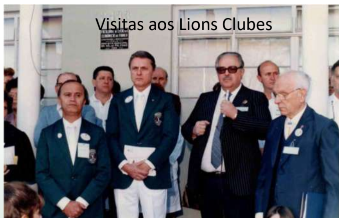
Visitas aos Lions Clubes

Agora é o momento de agir. Podemos causar e causaremos um impacto duradouro em nossas comunidades e no mundo. Junte-se a mim para tornar essa visão do nosso segundo século de serviço uma realidade.