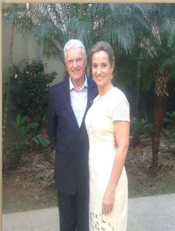
Casal Negrão Viotto