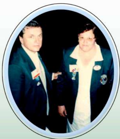
Casal Governador 89/90